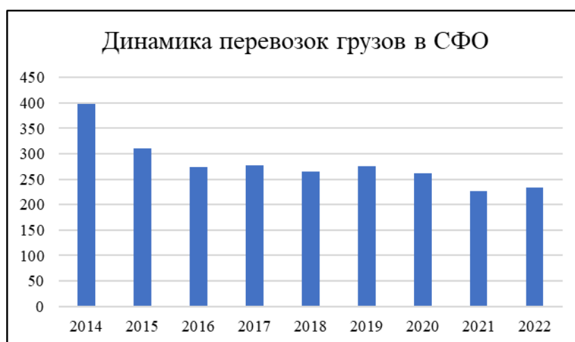
Рисунок 3 – Динамика перевозок грузов в Сибирском федеральном округе за 2014-2022 гг., в миллионах тонн

– представить структурный анализ предмета исследования (если это применимо);