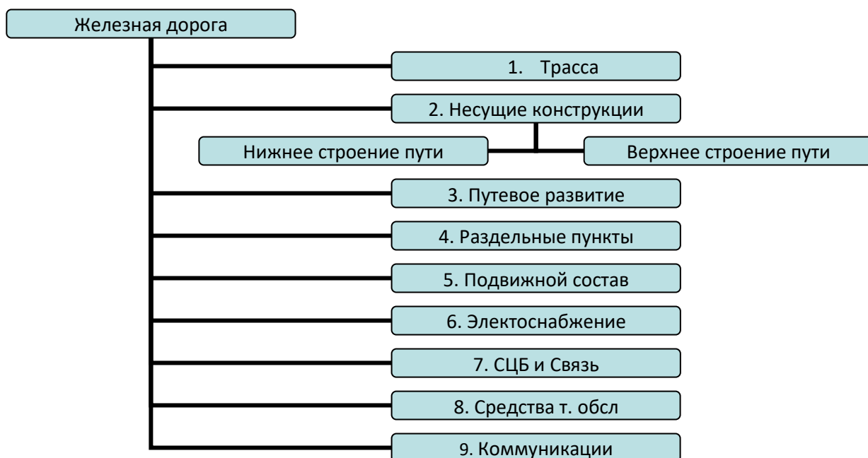
Рис.1. Система «Железная дорога»

Железная дорога может быть представлена в виде сложной многоуровневой системы, состоящей из ряда подсистем.